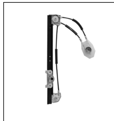
Nostro alzacristallo - our window regulator - notre lève-vitre - unser Fensterheber - nuestro elevalunas - nosso levantador de vidro - bizim cam acacagi - Γρύλος δικός μας