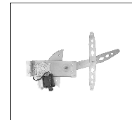
Nostro alzacristallo – our window regulator – notre lève-vitre – unser Fensterheber – nuestro elevallunas – nosso levantador de vidro - bizim cam acacagi - Γρύλος δικός μας