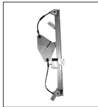
Nostro alzacristallo – our window regulator – notre lève-vitre – unser Fensterheber – nuestro elevalunas – nosso levantador de vidro - bizim cam acacagi - Γρύλος δικός μας