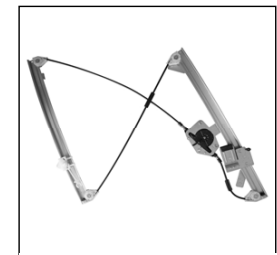
Nostro alzacristallo – our window regulator – notre lève-vitre – unser Fensterheber – nuestro elevalunas – nosso levantador de vidro - bizim cam acacagi - Γρύλος δικός μας