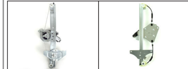
Alzacristallo originale - oem window regulator - lève-vitre original - Fensterheber von oem - elevallunas original - levantador de vidro original - orijinal cam acacagi - Γρύλος γνήσιος