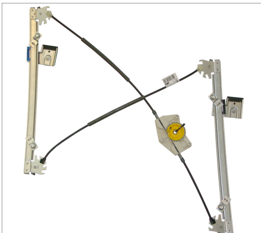
A POWER WINDOW LEFT ALZACRISTALLI ELETTRICO SX

THIS INSTALLATION INSTRUCTION IS FOR BOTH LEFT AND RIGHT SIDE. CETTE INSTRUCTION DE MONTAGE EST POUR LES DEUX COTES DROIT ET GAUCHE. DIESE MONTAGE-ANLEITUNG IST FÜR DIE BEIDE LINKE UND RECHTE SEITE. ESTA INSTRUCCION DE MONTAJE ES PARA LOS DOS LADOS IZQUIERDO Y DERECHO. ESTAS INSTRUÇÕES VALEM TANTO PARA O LADO ESQUERDO QUANTO PARA O DIREITO. LA PRESENTE ISTRUZIONE VALE SIA PER IL LATO SINISTRO CHE PER IL LATO DESTRO.