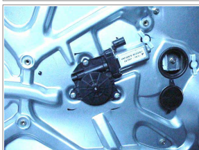
2 Doors - 2 Portes - 2 Türlig - 2 Puertas - 2 Porte left door - portière gauche - linke tür - puerta lado izquierdo - porta lato sinistro