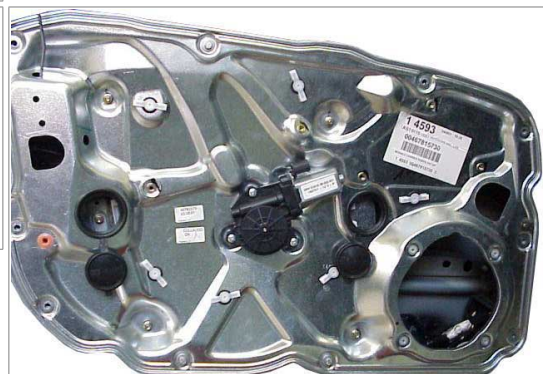
4 Doors - 4 Portes - 4 Türlig - 4 Puertas - 4 Porte Front Doors - Portes Avant - Vordere Türen - Puertas Anteriores - Porte Anteriori left door - portière gauche - linke tür - puerta lado izquierdo - porta lato sinistro