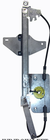
POWER WINDOW LEFT ALZCRISTALLI ELETTRICO SX

Citroën C-ELYSEE (DD_) (2012>) MECHANISM LH 9674437380* RH 9674437280*