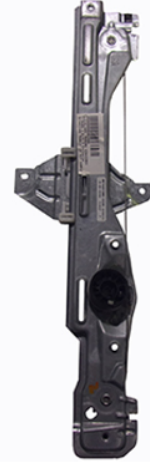
ORIGINAL POWER WINDOW ALZCRISTALLI ELETTRICO ORIGINALE