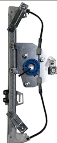
POWER WINDOW RIGHT ALZACRISTALLI ELETTRICO DX

THIS INSTALLATION INSTRUCTION IS FOR BOTH LEFT AND RIGHT SIDE. CETTE INSTRUCTION DE MONTAGE EST POUR LES DEUX COTES DROIT ET GAUCHE. DIESE MONTAGE-ANLEITUNG IST FÜR DIE BEIDE LINKE UND RECHTE SEITE. ESTA INSTRUCCION DE MONTAJE ES PARA LOS DOS LADOS IZQUIERDO Y DERECHO. ESTAS INSTRUÇÕES VALEM TANTO PARA O LADO ESQUERDO QUANTO PARA O DIREITO. DEZE AANWIJZINGEN GELDEN VOOR ZOWEL DE LINKER- ALS DE RECHTERKANT. Η ΠΑΡΟΥΣΑ ΟΔΗΓΙΑ ΑΦΟΡΑ ΤΟΣΟ ΤΗΝ ΑΡΙΣΤΕΡΗ ΟΣΟ ΚΑΙ ΤΗ ΔΕΞΙΑ ΠΛΕΥΡΑ. LA PRESENTE ISTRUZIONE VALE SIA PER IL LATO SINISTRO CHE PER IL LATO DESTRO.