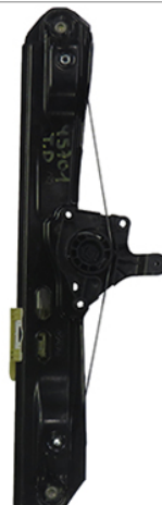
ORIGINAL POWER WINDOW RIGHT ALZACRISTALLI ELETTRICO ORIGINALE DX