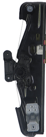
ORIGINAL POWER WINDOW LIFTER ALZACRISTALLI ELETTRICO ORIGINALE