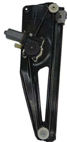
ORIGINAL POWER WINDOW LEFT ALZACRISTALLO ELETTRICO ORIGINALE SX