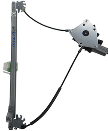
POWER WINDOW RIGHT ALZACRISTALLI LEETTRICO DX

THIS INSTALLATION INSTRUCTION IS FOR BOTH LEFT AND RIGHT SIDE. CETTE INSTRUCTION DE MONTAGE EST POUR LES DEUX COTES DROIT ET GAUCHE. DIESE MONTAGE-ANLEITUNG IST FÜR DIE BEIDE LINKE UND RECHTE SEITE. ESTA INSTRUCCION DE MONTAJE ES PARA LOS DOS LADOS IZQUIERDO Y DERECHO. ESTAS INSTRUÇÕES VALEM TANTO PARA O LADO ESQUERDO QUANTO PARA O DIREITO. DEZE AANWIJZINGEN GELDEN VOOR ZOWEL DE LINKER- ALS DE RECHTERKANT. Η ΠΑΡΟΥΣΑ ΟΔΗΓΙΑ ΑΦΟΡΑ ΤΟΣΟ ΤΗΝ ΑΡΙΣΤΕΡΗ ΟΣΟ ΚΑΙ ΤΗ ΔΕΞΙΑ ΠΛΕΥΡΑ. LA PRESENTE ISTRUZIONE VALE SIA PER IL LATO SINISTRO CHE PER IL LATO DESTRO.