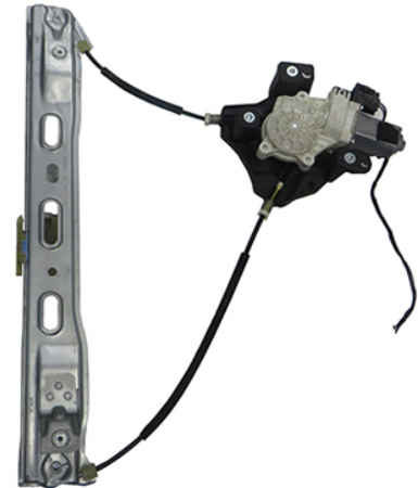
ORIGINAL POWER WINDOW RIGHT ALZACRISTALLI ELETTRICXO ORIGINALE DX