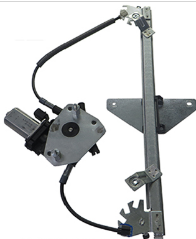
POWR WINDOW LEFT ALZACRISTALLI LETTRICO SX

THIS INSTALLATION INSTRUCTION IS FOR BOTH LEFT AND RIGHT SIDE. CETTE INSTRUCTION DE MONTAGE EST POUR LES DEUX COTES DROIT ET GAUCHE. DIESE MONTAGE-ANLEITUNG IST FÜR DIE BEIDE LINKE UND RECHTE SEITE. ESTA INSTRUCCION DE MONTAJE ES PARA LOS DOS LADOS IZQUIERDO Y DERECHO. AS PRESENTES INSTRUÇÕES VALEM TANTO PARA O LADO ESQUERDO QUANTO PARA O DIREITO. DEZE INSTRUCȚIE IS GELDIG VOOR ZOWEL DE LINKERKANT ALS DE RECHTERKANT. ΑΥΤΗ Η ΟΔΗΓΙΑ ΕΧΕΙ ΚΑΙ ΤΗΝ ΑΡΙΣΤΕΡΗ ΠΛΕΥΡΑ ΚΑΙ ΤΗΝ ΣΩΣΤΗ ΠΛΕΥΡΑ. LA PRESENTE ISTRUZIONE VALE SIA PER IL LATO SINISTRO CHE PER IL LATO DESTRO.