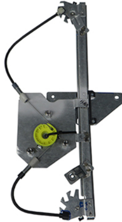
POWER WINDOW LEFT ALZACRISTALLI ELEGTRICO SX

THIS INSTALLATION INSTRUCTION IS FOR BOTH LEFT AND RIGHT SIDE. CETTE INSTRUCTION DE MONTAGE EST POUR LES DEUX COTES DROIT ET GAUCHE. DIESE MONTAGE-ANLEITUNG IST FÜR DIE BEIDE LINKE UND RECHTE SEITE. ESTA INSTRUCCION DE MONTAJE ES PARA LOS DOS LADOS IZQUIERDO Y DERECHO. AS PRESENTES INSTRUÇÕES VALEM TANTO PARA O LADO ESQUERDO QUANTO PARA O DIREITO. DEZE INSTRUCTIE IS GELDIG VOOR ZOWEL DE LINKERKANT ALS DE RECHTERKANT. ΑΥΤΗ Η ΟΔΗΓΙΑ ΕΧΕΙ ΚΑΙ ΤΗΝ ΑΡΙΣΤΕΡΗ ΠΛΕΥΡΑ ΚΑΙ ΤΗΝ ΣΩΣΤΗ ΠΛΕΥΡΑ. LA PRESENTE ISTRUZIONE VALE SIA PER IL LATO SINISTRO CHE PER IL LATO DESTRO.