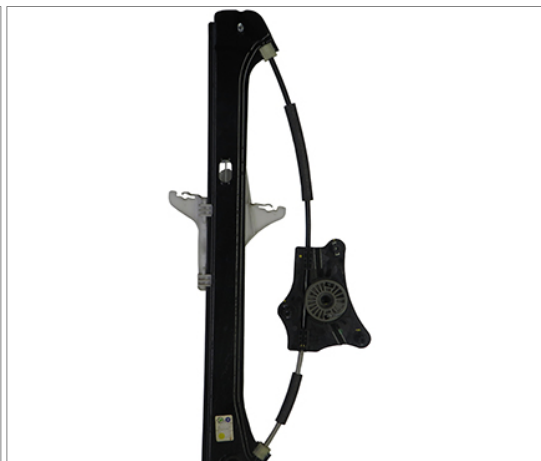
ORIGINAL POWER WIDOW LEFT ALZACRISTALLI ELETTRICO ORIGINALE SX