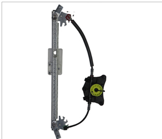
POWER WONDOW LEFT ALZACRISTALLI ELETTRICO SX

THIS INSTALLATION INSTRUCTION IS FOR BOTH LEFT AND RIGHT SIDE. CETTE INSTRUCTION DE MONTAGE EST POUR LES DEUX COTES DROIT ET GAUCHE. DIESE MONTAGE-ANLEITUNG IST FÜR DIE BEIDE LINKE UND RECHTE SEITE. ESTA INSTRUCCION DE MONTAJE ES PARA LOS DOS LADOS IZQUIERDO Y DERECHO. ESTAS INSTRUÇÕES VALEM TANTO PARA O LADO ESQUERDO QUANTO PARA O DIREITO. LA PRESENTE ISTRUZIONE VALE SIA PER IL LATO SINISTRO CHE PER IL LATO DESTRO.