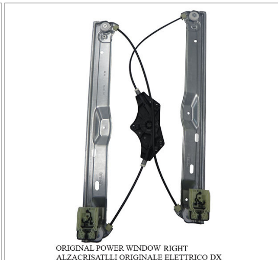
ORIGINAL POWER WINDOW RIGHT ALZACRISTALLI ORIGINALE ELETTRICO DX