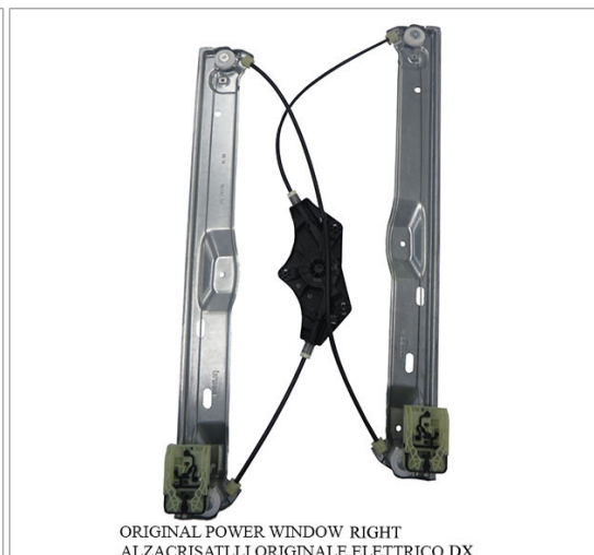
ORIGINAL POWER WINDOW RIGHT ALZACRISTALLI ORIGINALE ELETTRICO DX