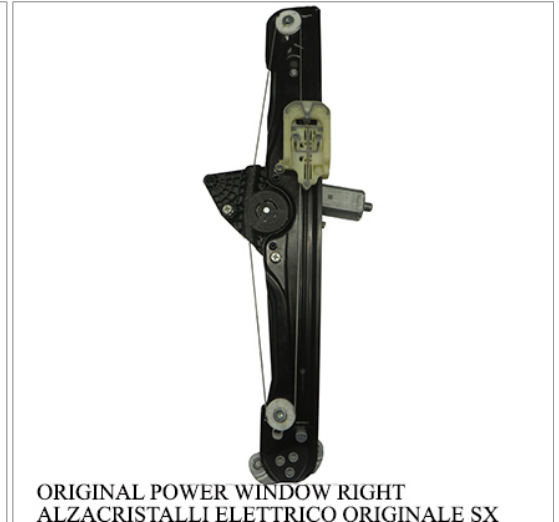
ORIGINAL POWER WINDOW RIGHT ALZACRISTALLI ELETTRICO ORIGINALE SX