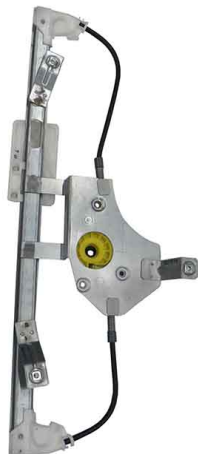
POWER WINDOW LEFT ALZACRISTALLI ELETTRICO SINISTRO

THIS INSTALLATION INSTRUCTION IS FOR BOTH LEFT AND RIGHT SIDE. CETTE INSTRUCTION DE MONTAGE EST POUR LES DEUX COTES DROIT ET GAUCHE. DIESE MONTAGE-ANLEITUNG IST FÜR DIE BEIDE LINKE UND RECHTE SEITE. ESTA INSTRUCCION DE MONTAJE ES PARA LOS DOS LADOS IZQUIERDO Y DERECHO. ESTAS INSTRUÇÕES VALEM TANTO PARA O LADO ESQUERDO QUANTO PARA O DIREITO. DEZE AANWIJZINGEN GELDEN VOOR ZOWEL DE LINKER- ALS DE RECHTERKANT. Η ΠΑΡΟΥΣΑ ΟΔΗΓΙΑ ΑΦΟΡΑ ΤΟΣΟ ΤΗΝ ΑΡΙΣΤΕΡΗ ΟΣΟ ΚΑΙ ΤΗ ΔΕΞΙΑ ΠΛΕΥΡΑ. LA PRESENTE ISTRUZIONE VALE SIA PER IL LATO SINISTRO CHE PER IL LATO DESTRO.