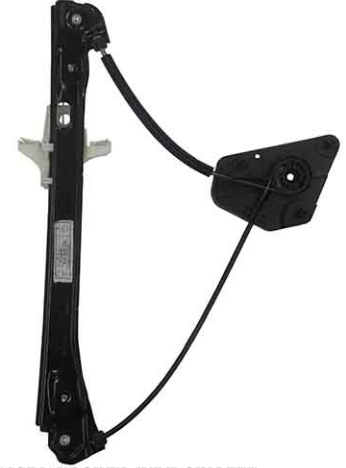
ORIGINAL POWER WINDOW LEFT ALZACRISTALLI ELETTRICO O ORIGINALE SX