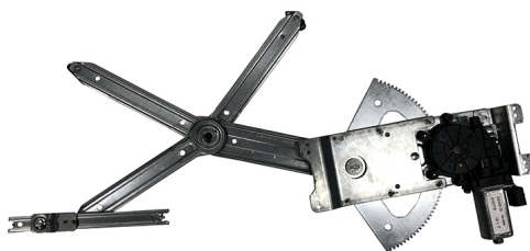
POWER WINDOW LEFT ALZACRISTALLI ELETTRICO SX

THIS INSTALLATION INSTRUCTION IS FOR BOTH LEFT AND RIGHT SIDE. CETTE INSTRUCTION DE MONTAGE EST POUR LES DEUX COTES DROIT ET GAUCHE. DIESE MONTAGE-ANLEITUNG IST FÜR DIE BEIDE LINKE UND RECHTE SEITE. ESTA INSTRUCCION DE MONTAJE ES PARA LOS DOS LADOS IZQUIERDO Y DERECHO. AS PRESENTES INSTRUÇÕES VALEM TANTO PARA O LADO ESQUERDO QUANTO PARA O DIREITO. LA PRESENTE ISTRUZIONE VALE SIA PER IL LATO SINISTRO CHE PER IL LATO DESTRO.