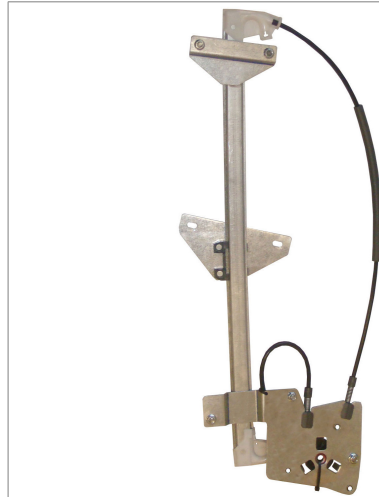
POWER WINDOW LEFT ALZACRISTALLO ELETTRICO SX

THIS INSTALLATION INSTRUCTION IS FOR BOTH LEFT AND RIGHT SIDE. CETTE INSTRUCTION DE MONTAGE EST POUR LES DEUX COTES DROIT ET GAUCHE. DIESE MONTAGE-ANLEITUNG IST FÜR DIE BEIDE LINKE UND RECHTE SEITE. ESTA INSTRUCCION DE MONTAJE ES PARA LOS DOS LADOS IZQUIERDO Y DERECHO. DESE AANWIJZINGEN GELDEN VOOR ZOWEL DE LINKER- ALS DE RECHTERKANT. Η ΠΑΡΟΥΣΑ ΟΔΗΓΙΑ ΑΦΟΡΑ ΤΟΣΟ ΤΗΝ ΑΡΙΣΤΕΡΗ ΟΣΟ ΚΑΙ ΤΗ ΔΕΞΙΑ ΠΛΕΥΡΑ. LA PRESENTE ISTRUZIONE VALE SIA PER IL LATO SINISTRO CHE PER IL LATO DESTRO.