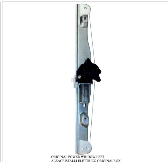
ORIGINAL POWER WINDOW LEFT ALZACRISTALLI ELETRICO ORIGINALE SX