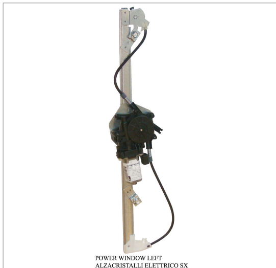
POWER WINDOW LEFT ALZACRISTALLI ELETRICO SX

THIS INSTALLATION INSTRUCTION IS FOR BOTH LEFT AND RIGHT SIDE. CETTE INSTRUCTION DE MONTAGE EST POUR LES DEUX COTES DROIT ET GAUCHE. DIESE MONTAGE-ANLEITUNG IST FÜR DIE BEIDE LINKE UND RECHTE SEITE. ESTA INSTRUCCION DE MONTAJE ES PARA LOS DOS LADOS IZQUIERDO Y DERECHO. ESTAS INSTRUÇÕES VALEM TANTO PARA O LADO ESQUERDO QUANTO PARA O DIREITO. DEZE AANWIJZINGEN GELDEN VOOR ZOWEL DE LINKER- ALS DE RECHTERKANT. Η ΠΑΡΟΥΣΑ ΟΔΗΓΙΑ ΑΦΟΡΑ ΤΟΣΟ ΤΗΝ ΑΡΙΣΤΕΡΗ ΟΣΟ ΚΑΙ ΤΗ ΔΕΞΙΑ ΠΛΕΥΡΑ. LA PRESENTE ISTRUZIONE VALE SIA PER IL LATO SINISTRO CHE PER IL LATO DESTRO.