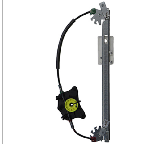
POWER WINDOW RIGHT ALZACRISTALLI ELETTRICO DX

THIS INSTALLATION INSTRUCTION IS FOR BOTH LEFT AND RIGHT SIDE. CETTE INSTRUCTION DE MONTAGE EST POUR LES DEUX COTES DROIT ET GAUCHE. DIESE MONTAGE-ANLEITUNG IST FÜR DIE BEIDE LINKE UND RECHTE SEITE. ESTA INSTRUCCION DE MONTAJE ES PARA LOS DOS LADOS IZQUIERDO Y DERECHO. ESTAS INSTRUÇÕES VALEM TANTO PARA O LADO ESQUERDO QUANTO PARA O DIREITO. LA PRESENTE ISTRUZIONE VALE SIA PER IL LATO SINISTRO CHE PER IL LATO DESTRO.