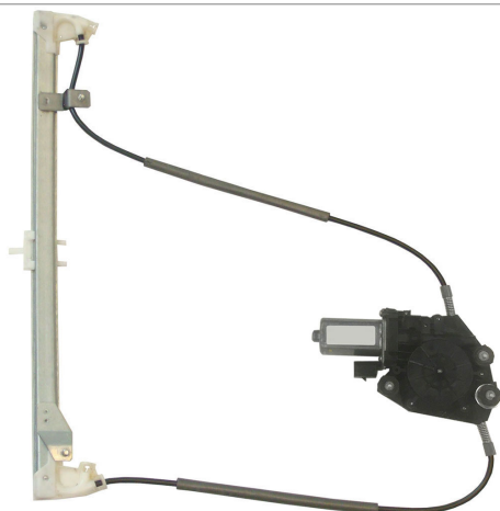
POWER WINDOW LEFT ALZACRISTALLI ELETTRICO SX

THIS INSTALLATION INSTRUCTION IS FOR BOTH LEFT AND RIGHT SIDE. CETTE INSTRUCTION DE MONTAGE EST POUR LES DEUX COTES DROIT ET GAUCHE. DIESE MONTAGE-ANLEITUNG IST FÜR DIE BEIDE LINKE UND RECHTE SEITE. ESTA INSTRUCCION DE MONTAJE ES PARA LOS DOS LADOS IZQUIERDO Y DERECHO. ESTAS INSTRUÇÕES VALEM TANTO PARA O LADO ESQUERDO QUANTO PARA O DIREITO. DEZE AANWIJZINGEN GELDEN VOOR ZOWEL DE LINKER- ALS DE RECHTERKANT. Η ΠΑΡΟΥΣΑ ΟΔΗΓΙΑ ΑΦΟΡΑ ΤΟΣΟ ΤΗΝ ΑΡΙΣΤΕΡΗ ΟΣΟ ΚΑΙ ΤΗ ΔΕΞΙΑ ΠΛΕΥΡΑ. LA PRESENTE ISTRUZIONE VALE SIA PER IL LATO SINISTRO CHE PER IL LATO DESTRO.