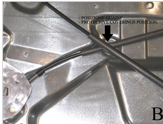
- POSIZIONE GUAINA - PROTECTIVE COVERINGS POSITION.