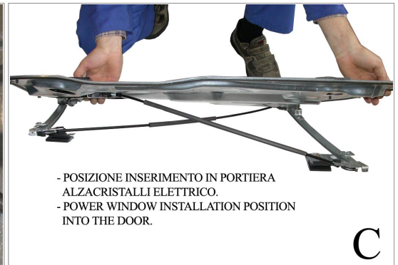
- POSIZIONE INSERIMENTO IN PORTIERA ALZACRISTALLI ELETTRICO. - POWER WINDOW INSTALLATION POSITION INTO THE DOOR.