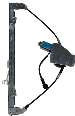
POWER WINDOW LEFT ALZACRISTALLI ELETRICO SX

THIS INSTALLATION INSTRUCTION IS FOR BOTH LEFT AND RIGHT SIDE. CETTE INSTRUCTION DE MONTAGE EST POUR LES DEUX COTES DROIT ET GAUCHE. DIESE MONTAGE-ANLEITUNG IST FÜR DIE BEIDE LINKE UND RECHTE SEITE. ESTA INSTRUCCION DE MONTAJE ES PARA LOS DOS LADOS IZQUIERDO Y DERECHO. AS PRESENTES INSTRUÇÕES VALEM TANTO PARA O LADO ESQUERDO QUANTO PARA O DIREITO. DEZE AANWIJZINGEN GELDEN VOOR ZOWEL DE LINKER- ALS DE RECHTERKANT. Η ΠΑΡΟΥΣΑ ΟΔΗΓΙΑ ΑΦΟΡΑ ΤΟΣΟ ΤΗΝ ΑΡΙΣΤΕΡΗ ΟΣΟ ΚΑΙ ΤΗ ΔΕΞΙΑ ΠΛΕΥΡΑ. LA PRESENTE ISTRUZIONE VALE SIA PER IL LATO SINISTRO CHE PER IL LATO DESTRO.