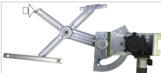
POWER WINDOW LEFT ALZACRISTALLI ELETTRICO SX

THIS INSTALLATION INSTRUCTION IS FOR BOTH LEFT AND RIGHT SIDE. CETTE INSTRUCTION DE MONTAGE EST POUR LES DEUX COTES DROIT ET GAUCHE. DIESE MONTAGE-ANLEITUNG IST FÜR DIE BEIDE LINKE UND RECHTE SEITE. ESTA INSTRUCCION DE MONTAJE ES PARA LOS DOS LADOS IZQUIERDO Y DERECHO. ESTAS INSTRUÇÕES VALEM TANTO PARA O LADO ESQUERDO QUANTO PARA O DIREITO. LA PRESENTE ISTRUZIONE VALE SIA PER IL LATO SINISTRO CHE PER IL LATO DESTRO.