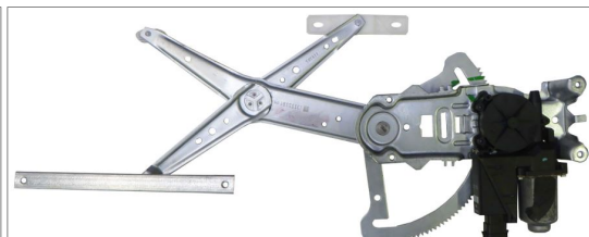
ORIGINAL POWER WINDOW LEFT ALZACRISTALLI ELETTRICO ORIGINALE SX