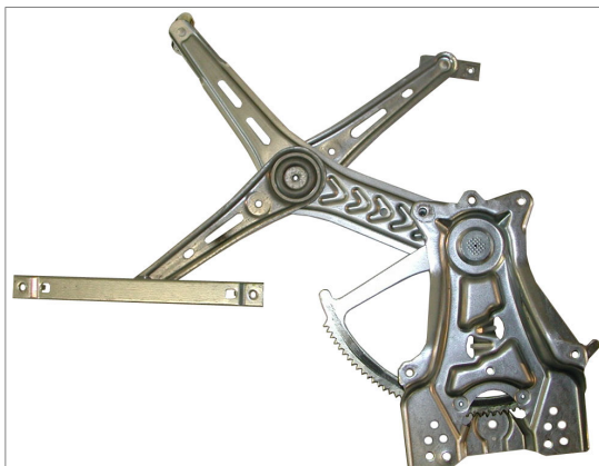
ORIGINAL POWER WINDOW LEFT ALZACRISTALLI ELETTRICO ORIGINALE SX