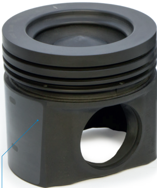
Tłoki oferowane przez firmę Kolbenschmidt