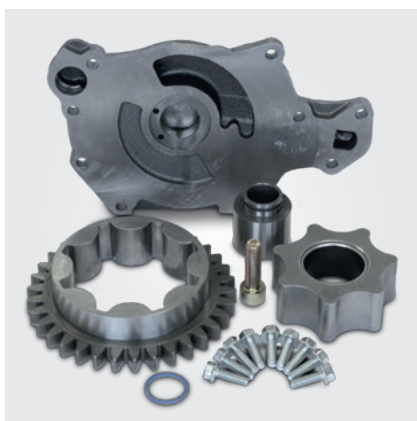
Каталожный № изделия 20 1402 20660