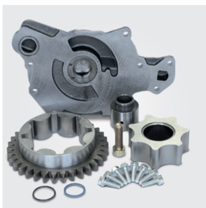
Каталожный № изделия 20 1402 26761