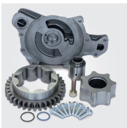
Каталожный № изделия 20 1402 26760