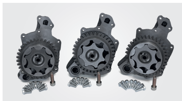
Масляные насосы для двигателей MAN

Мы сохраняем за собой право на изменения и несоответствие рисунков.