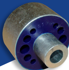
Cojinete De Poliuretano - ADT380145