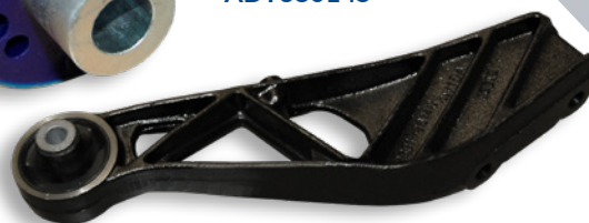
Soporte completo - ADT38056C