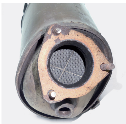
Ilustracja 1. Wymontowany filtr cząstek stałych

W trakcie procesu spalania w silniku powstają drobiny sadzy, które w czasie filtrowania spalin osadzają się nieustannie w filtrze DPF. W przeciwieństwie do reaktora katalitycznego, filtr cząstek stałych ma jednak ograniczoną zdolność pochłaniania i należy go poddawać regeneracjom lub wymianom w określonych cyklach.