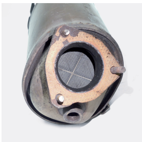
Рисунок 1: Демонтированный сажевый фильтр

Если после монтажа турбонагнетателя проблемы с мощностью автомобиля не прекращаются или новый турбонагнетатель сразу же выходит из строя, то причиной тому может быть сажевый фильтр.