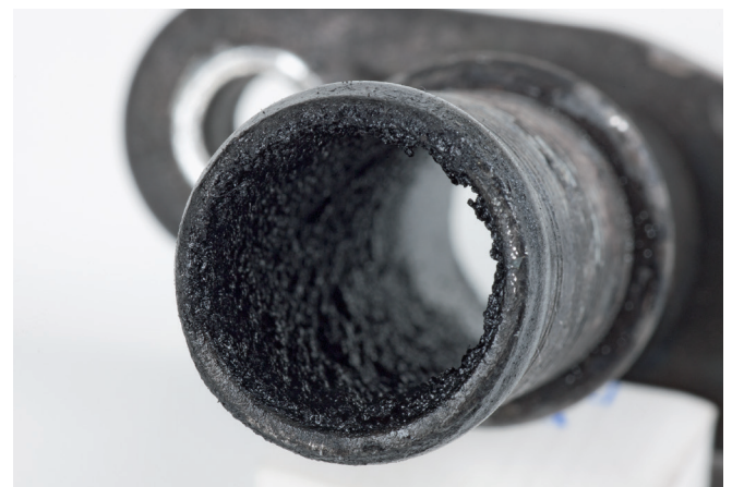
Figure 4 : Résidus de calamine dans la conduite de retour d'huile suite au passage des gaz d'échappement.

IMPORTANT ! Lors du montage du nouveau turbo-compresseur, vérifiez absolument aussi l'état de charge du filtre à particules diesel !