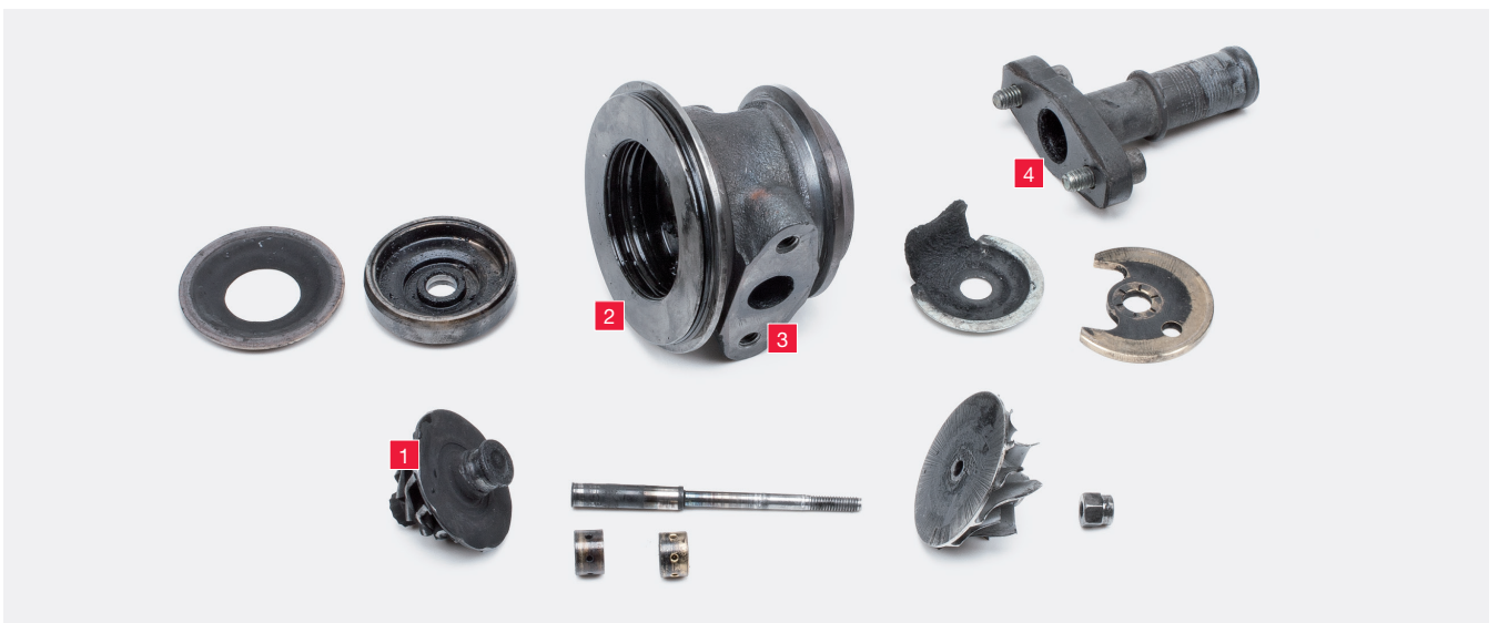
Figure 2: Passage des gaz d'échappement à travers le carter de palier – de la roue de turbine 1 dans le carter de palier 2, puis par la vidange d'huile 3 dans la conduite de retour 4

Les gaz d'échappement passent du moteur au turbocompresseur et au filtre à particules. En raison de la contre-pression trop élevée, les gaz d'échappement ne peuvent plus circuler librement par le FPD et pénètrent dans le pire des cas dans le carter de palier et lave le film d'huile des paliers radiaux (figure 2).