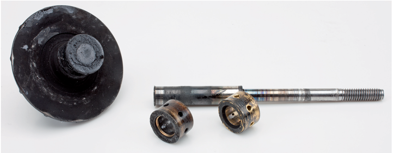
Figure 3 : Arbre de rotor cassé en raison d'une lubrification insuffisante du palier radial

Il s'ensuit une usure accrue voire une carbonisation et une rupture rapide de l'arbre de rotor (figure 3). Des résidus de calamine dans la conduite de retour d'huile du carter d'huile sont une indication claire de ce type de dommages (figure 4).