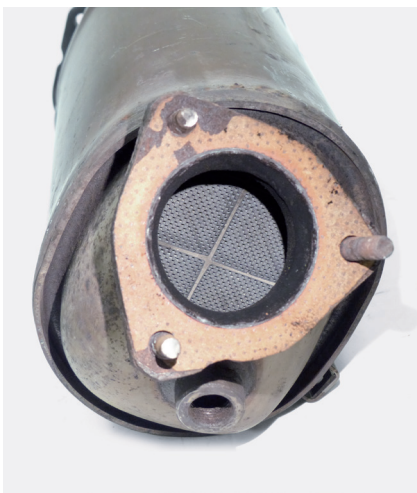
Εικόνα 1: Απεγκατεστημένο φίλτρο σωματιδίων ντίζελ

Εάν, μετά την εγκατάσταση ενός στροβιλοσυμπιεστή, προκύψουν προβλήματα ισχύος ή ακόμη και άμεση βλάβη του καινούριου στροβιλοσυμπιεστή, αυτό ενδέχεται να οφείλεται στο φίλτρο σωματιδίων ντίζελ (DPF).