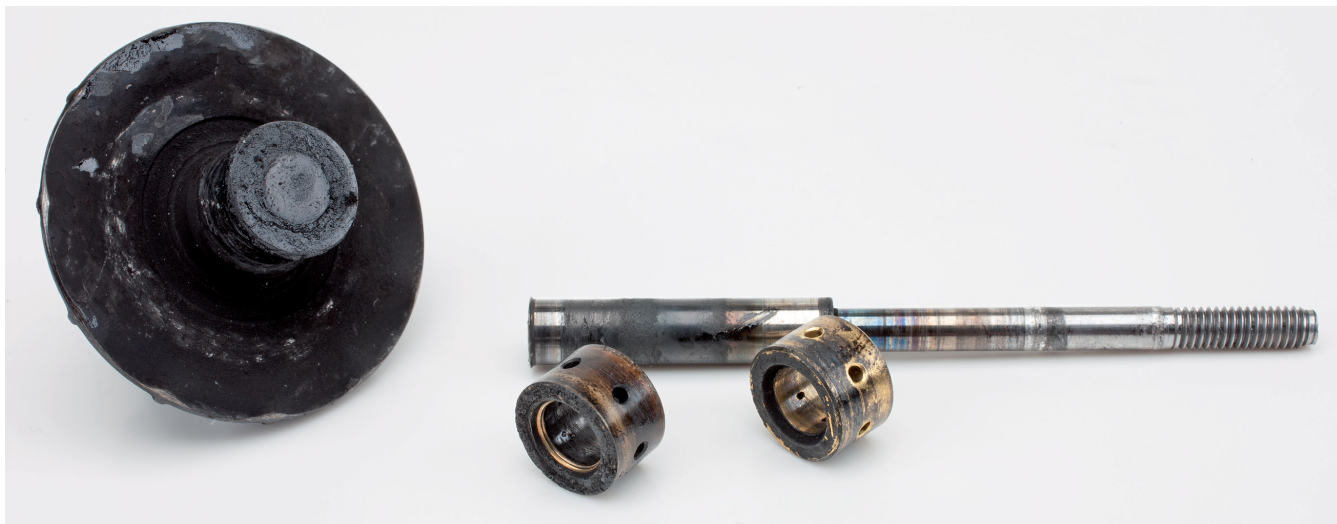
Ilustracja 3. Wał wirnika pęknięty wskutek niedostatecznego nasmarowania łożyska promieniowego

Skutkuje to przyśpieszonym zużyciem, a czasami także wyrobieniem, a w konsekwencji pęknięciem wału wirnika (Ilustracja 3). Występowanie nagaru wewnątrz przewodu powrotnego oleju prowadzącego do miski olejowej stanowi wyraźny objaw tego uszkodzenia (Ilustracja 4).