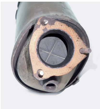
Figure 1: Disassembled diesel particulate filter

If performance issues continue to arise after a new turbocharger is fitted, or if the new turbocharger fails immediately, the diesel particulate filter (DPF) may be the cause.