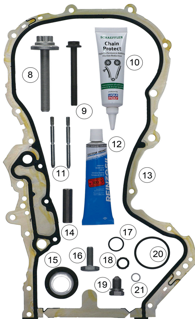
Obrázek 2: 559 0154 30/559 0154 31 - montážní díly pro sadu rozvodového řetězu

Jako pomoc při montáži skříně rozvodů a olejové vany jsou v sadě pro rozvodový řetěz dodávány vodicí kolíky. Ty se našroubují do hlavy válců popř. do bloku válců.