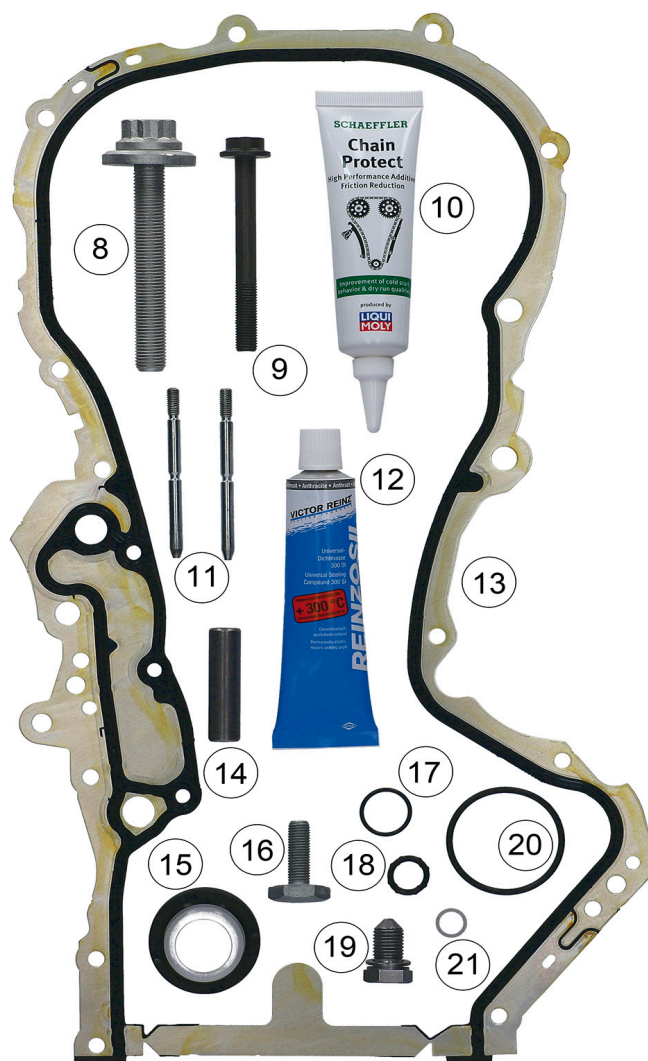
Снимка 2: 559 0154 30/559 0154 31 – Аксесоари към комплектите ангренажни вериги

Като помощно средство за монтаж при монтиране на капачката на ангренажната верига и масления картер, направляващите щифтове са включени в двата комплекта ангренажни вериги. Завийте ги съответно в цилиндричната глава и цилиндричния блок.