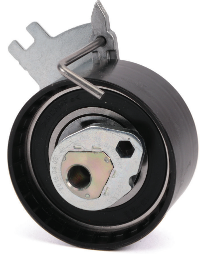
Resim 2: 531 0885 10 değiştirilmiş gergi rulmanı

Ürünlerimizi geliştirme konusundaki sürekli çabalarımızın bir parçası olarak, Schaeffler Automotive Aftermarket, 531 0885 10 gergi rulmanını değiştirmiştir (Resim 2). Bu belirtilen her motor şekillerinde kullanılabileceği anlamına gelir. Gergi rulmanı 531 0810 10 (Resim 1) artık gerekli değildir.