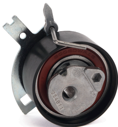
Εικόνα 1: Τεντωτήρας 531 0810 10

Και οι δύο εκδόσεις πληρούν τις τεχνικές προδιαγραφές και μπορούν να χρησιμοποιηθούν χωρίς περιορισμούς. Κατά τη μετάβαση στον νέο σχεδιασμό, μπορεί να υπάρχουν στις αποθήκες διαθέσιμοι και οι δύο σχεδιασμοί.