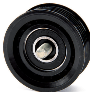
Fig. 2: 532 0471 10 - Nuevo modelo