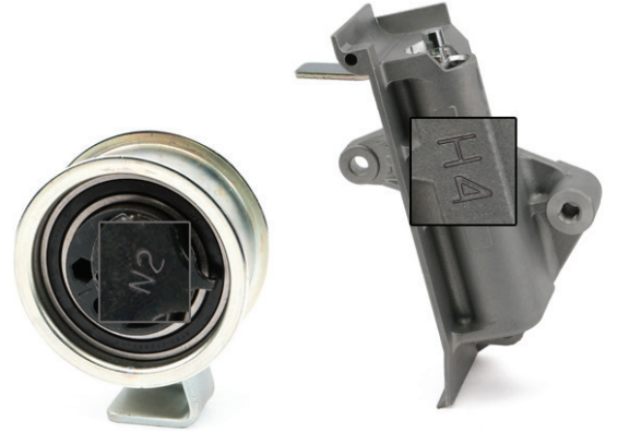
Resim 2: 531 0436 20 gergi rulmanı, 533 0035 10 titreşim damperisi ile birlikte