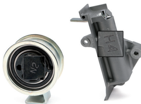
Figura 2: Rullo tenditore 531 0436 20 con smorzatore di vibrazioni 533 0035 10