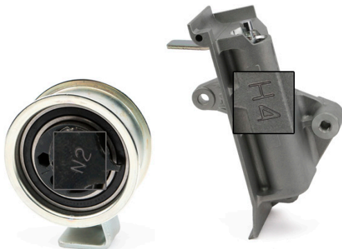
איור 2: גלגלת מותחן מק"ט – 531 0436 20 עם משכך רעידות מק"ט – 533 0035 10