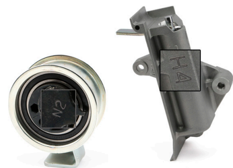
Снимка 2: Обтяжна ролка 531 0436 20 с вибрационен демпфер 533 0035 10

За изброените тук превозни средства винаги спазвайте определената комбинация от обтяжни ролки и вибрационни демпфери.