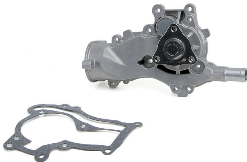
Fig. 1: 538 0314 10 - koelmiddelpomp met meegeleverde vlakke afdichting

Actuele selectie zie onderdelencatalogus