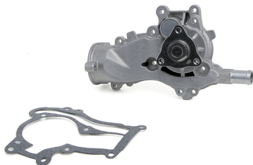
Photo 1 : 538 0314 10 – Pompe à eau avec joint d'étanchéité

Pour l'attribution actuelle voir nos catalogues