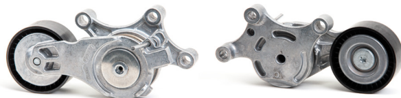
2. attēls: Jaunā konstrukcija

Kā daļu no saviem pastāvīgajiem centieniem uzlabot savus produktus, esam veikuši izmaiņas siksnas spriegotājam ar detaļas numuru 534 0075 20.