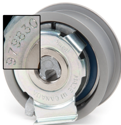
Bild 2: 531 0851 10 – spännrulle nytt utförande (979830)

Montering av spännrulle 979743 i stället för spännrulle 979830 är förbjudet!