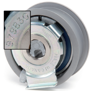
Fig. 2: 531 0851 10 – Polea tensora nueva (979830)

Debido a especificaciones modificadas, la polea tensora 531 0851 10 sustituye a la polea tensora 531 0777 10.