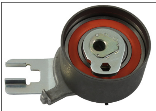
Fig. 2: 531 0515 10 – oude spanrol

Vervangingsonderdelen en technische informatie kan u terugvinden op www.schaeffler-aftermarket.com of www.RepXpert.com