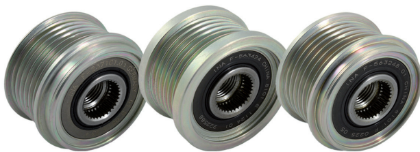
Fig. 2: Dynamovrijlooprollen 535 0063 10 (links), 535 0202 10 (midden), 535 0203 10 (rechts)

Schaeffler Automotive Aftermarket adviseert de betrokken voertuigen met starre dynamorol uit te rusten met een dynamovrijlooprol. Let op: Neem altijd de bijgevoegde montage-instructie in acht!