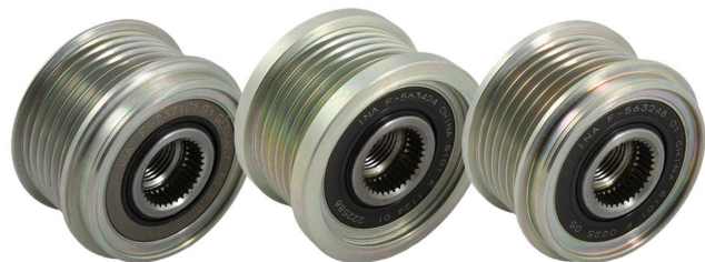
Obrázek 2: Alternátorová volnoběžka 535 0063 10 (vlevo), 535 0202 10 (uprostřed), 535 0203 10 (vpravo)

U výše uvedených vozidel s tuhým řemenicím alternátoru může docházet k vibracím a rušivým hlukům z oblasti pohonu přídatných agregátů. Ty vznikají v důsledku daleko větší nerovnoměrnosti rychlosti otáčení u vznětových motorů v porovnání se zážehovými motory.